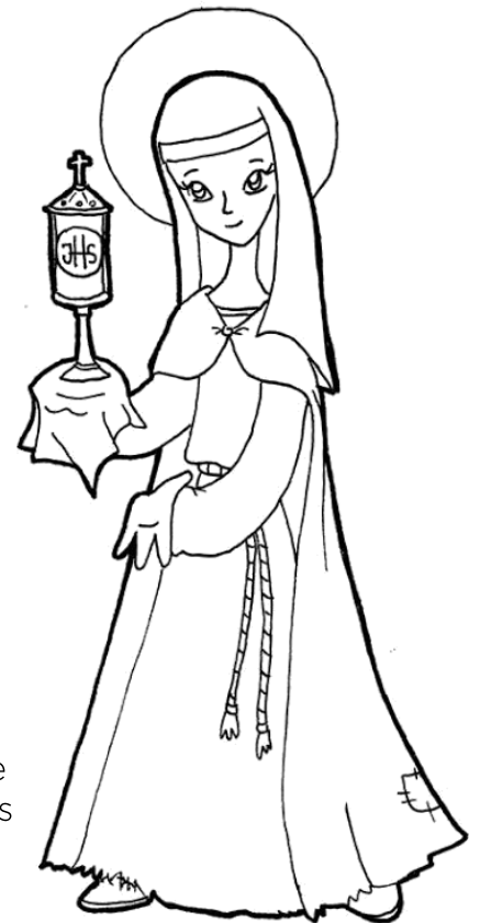
St. Clare of Assisi

Podemos disfrutar nuestros tiempos libres haciendo muchas cosas que son divertidas. Sin embargo, siempre debemos tratar de hacer tiempo para pasarlo en oración. A lo largo de este año escolar trate de pasar tiempo en oración frente al Santísimo Sacramento. Comparte tus preocupaciones y tus buenas noticias con Jesús presente en el Santísimo. Tal como lo haces cuando hablas con tus amigos.